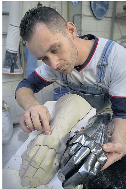
Tichelaar Makkum maakt de harnassen van porselein.